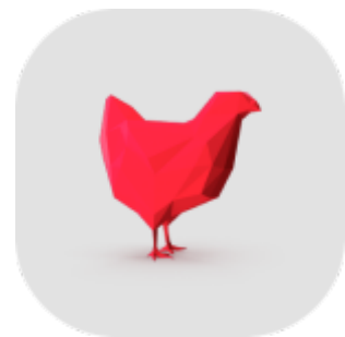
Frangos de Corte