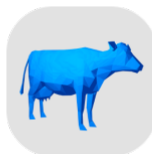
Bovinos de Leite