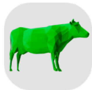
Bovinos de Corte